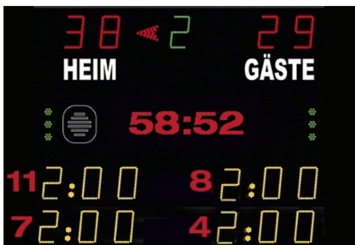
Abbildung 1: Beispiel Anzeigetafel

Das Anzeige-System in der Spielstätte muss eine öffentliche Zeitmessanlage sein, die von allen Zuschauerplätzen und insbesondere vom Zeitnehmertisch ohne Einschränkungen eingesehen werden kann. Werden auf der Anzeigetafel Zeitstrafen angezeigt, so müssen mindestens zwei Hinausstellungen pro Verein inkl. Spielernummer und Strafzeit (siehe Abbildung 1) angezeigt werden können. Sollte dies nicht möglich sein, so ist bei Hinausstellungen die Zeit des Wiedereintritts inkl. Spielernummer jeweils auf einem Vordruck in Papierform einzutragen und sichtbar anzubringen.